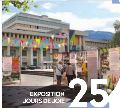
EXPOSITION JOURS DE JOIE