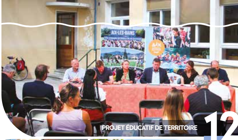
PROJET ÉDUCATIF DE TERRITOIRE