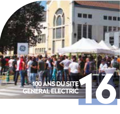
100 ANS DU SITE GENERAL ELECTRIC